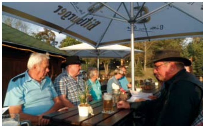
In Neukieritzsch auf der Buffalo Ranch

Eine Veranstaltung zur Stärkung des Vereinslebens führten wir am 29. September 2023 durch. Wir trafen uns auf der Buffalo Ranch in Neukieritzsch. Danke Thomas für die Organisation.