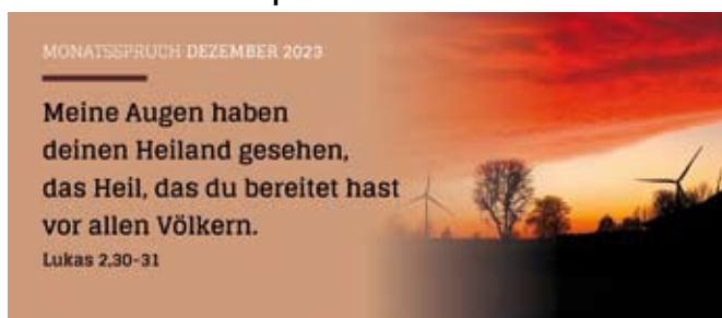
Text: Lutherbibel, revidiert 2017, © 2016 Deutsche Bibelgesellschaft, Stuttgart – Grafik: © GemeindebriefDruckerei