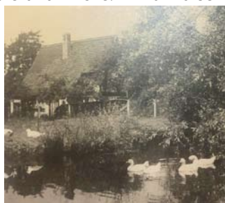
Idylle am Mühlgraben