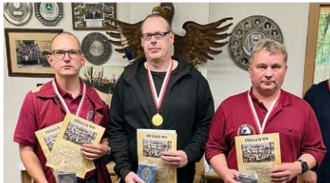
Thüringer Landesmeisterschaft am 1. Juni 2024