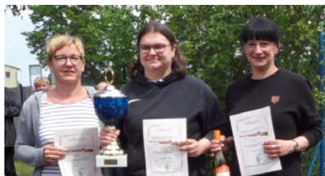
Die Sieger Mannschaft vom Schießen der Vereine

Zum traditionellen Schießen der Vereine hatten wir am 1. Juni 2024 ins Schützenhaus eingeladen. Wir haben uns sehr über die starke Beteiligung in diesem Jahr gefreut. Angetreten waren 7 Mannschaften. Sieger wurde die Frauen Mannschaft „Haselbacher Lachtauben“. Den 2. Platz belegte der „Kulturbund“ und den 3. Platz das „Team Bierschuppen“.