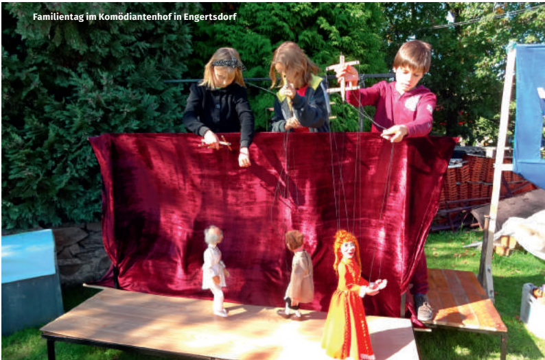
Familiertag im Komödiantenhof in Engersdorf

Das Transportflugzeug »Transall« oder der U-Boot-Jäger »Atlantic« sind nur zwei der kolossalen originalen Ausstellungsstücke vom Museum Flugwelt am Nobitzer Airport. Besucher können die Riesen der Lüfte besichtigen und sich im Cockpit ausprobieren. Kleine Besucher verzaubert das traditionsreiche Marionettentheater Dombrowsky mittlerweile in siebter Generation. Nach weit über 100 Jahren Reisen durch die Region hat das historische Wandlerpuppentheater seit 1999 seine feste Heimat im »Hinteruhmannsdorfer Komödiantenhof« in Engersdorf gefunden. Spannung ganz anderer Art kann man im einmaligen Labyrinthhaus in Thüringen erleben. Im Altenburger Hausweg wurde dafür eigens eine einstige Kaserne umgebaut. Bei aller Verwirrung ging dort aber noch nie jemand verloren!