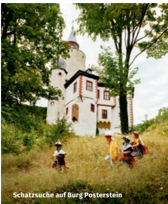
Schatzsuche auf Burg Posterstein

Burgen, Ritter und geheimnisvolle Sagen – das hat das Altenburger Land gleich mehrfach zu bieten. Burg Posterstein, auf einem Bergfried über dem gleichnamigen idyllischen Ort gelegen, ist allein schon einen Besuch wert. Mit dem dazugehörigen Museum präsentiert Burg Posterstein darüber hinaus sehenswerte Ausstellungen rund um Ritter, Fräuleins und Historie.