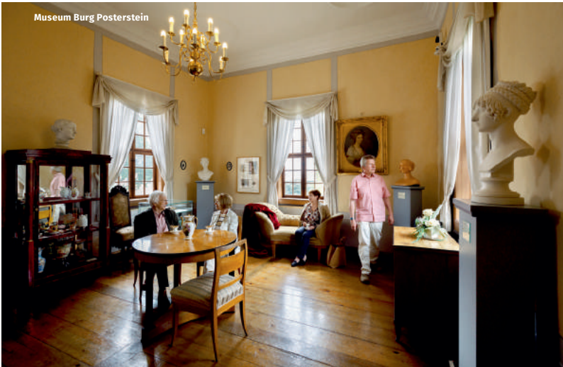
Museum Burg Posterstein

Erhaben thront das imposante Altenburger Schloss über der Residenzstadt und zieht Besucher in seinen Bann. Selten kommt man der herzoglichen Wohnkultur, Kartenmacherei oder der Stadtgeschichte so nahe wie in diesem historischen Gemäuer. Atemberaubend sind nicht nur die prächtigen Festsäle des Schlosses, sondern auch die Ansicht der zahlreichen unterschiedlichen Baustile, die sich in der Architektur des Schlosses wiederfinden. Eingebettet im Schlosspark laden das Teehaus mit Orangerie, das Lindenau-Museum oder das naturkundliche Museum Mauritianum zum Entspannen ein. Beim Besuch der drei ansässigen Gotteshäuser – der Brüder-, Bartholomäi- und Agneskirche, kommen auch Freunde sakraler Bauwerke auf ihre Kosten.