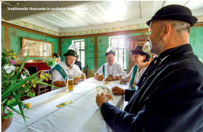
Traditionelle Skatrunde in rustikaler Bohlenstube

Das Altenburger Land steht für gepflegte und gelebte reiche bäuerliche Tradition. Malcher und Marche heißen die traditionellen und prächtigen Trachten der Bauernschaft, die zu besonderen Anlässen vielerorts noch getragen werden. Vor allem die Damen, die Marchen, sind mit ihrem aufwendig gestalteten Kopfschmuck ein echter Hingucker. 2013 war diese typische Altenburger Bauerntracht sogar die Tracht des Jahres in Deutschland. Dieses Brauchtum lebt in vielfältiger Weise fort: Überall im Altenburger Land sind die opulenten Viersiekhöfe zu bewundern. Die alten Bräuche werden jährlich auf den Bauernmärkten, dem Garbisdorfer Vogelschießen, der Rositzer Kirmes oder dem Mühlenfest in Hartha zelebriert.