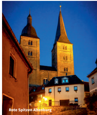
Rote Spitzen Altenburg

Es ist tatsächlich nur ein Märchen, dass die Roten Spitzen dem Bart von Kaiser Barbarossa nachempfunden sind. Wahr ist aber, dass die beiden markanten Türme aus roten Backsteinen zu Zeiten des Stauferkaisers entstanden, und heute eines der Wahrzeichen der Skatstadt sind. Darüber hinaus hat der Kreis ebenfalls viel zu bieten: Die Burg Posterstein, das Rittergut in Treben oder der Markt in Schmölln laden zu einem Besuch ein.