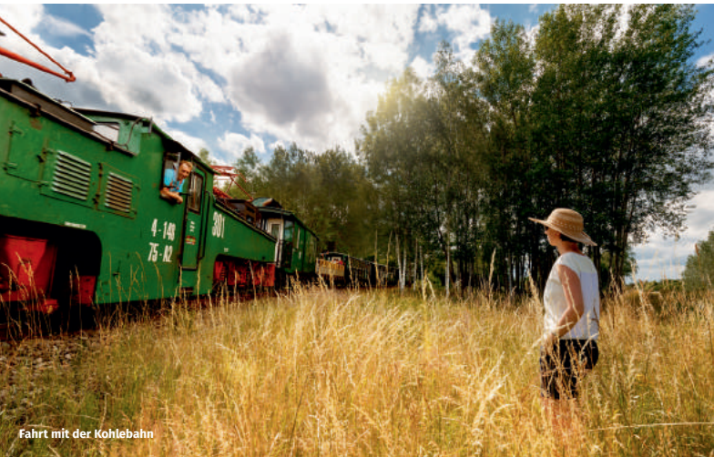
Fahrt mit der Kohlebahn