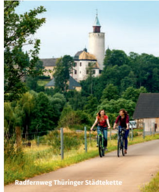
Radfernweg Thüringer Städtekette

Über den gesamten Altenburger Landkreis erstreckt sich ein bestens ausgebautes Radwegnetz. Dank diesem können die zahlreichen Attraktionen problemlos mit dem Fahrrad erreicht werden. Die Skatstadt Altenburg ist auch Startpunkt der Thüringer Städtekette. Aktivurlauber können von hier aus den gesamten Freistaat in reizvoller Natur entdecken.