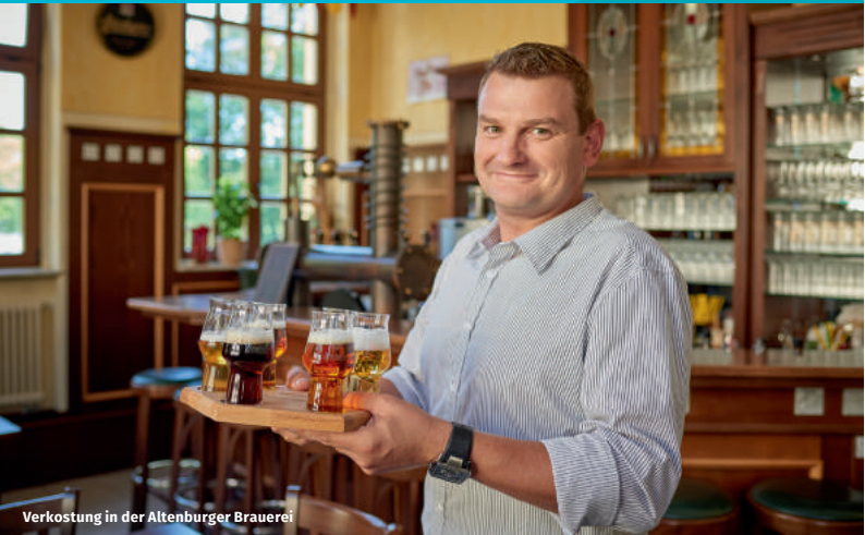
Verkostung in der Altenburger Brauerei