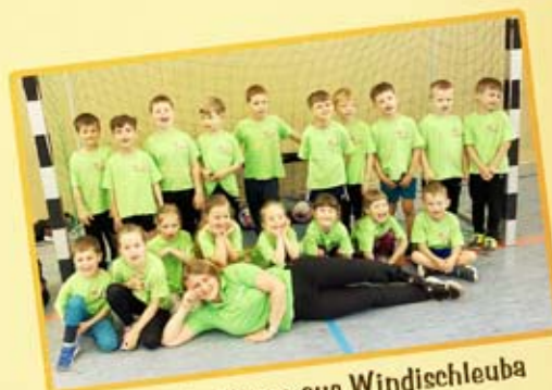
Schulanfänger aus Windischleuba