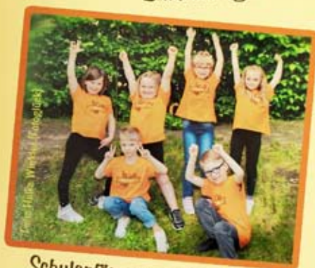
Schulanfänger aus Haselbach