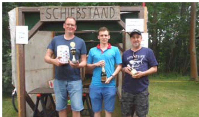
Die Sieger am Armbrustschießstand