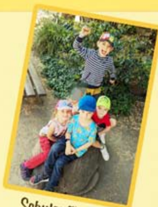
Schulanfänger aus Treben