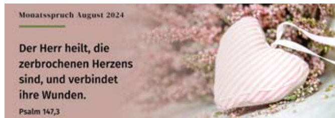
Monatsspruch August 2024 Text: Lutherbibel, revidiert 2017, © 2016 Deutsche Bibelgesellschaft, Stuttgart - Grafik: © GemeindebriefDruckerei

Mit diesem Konzert möchten wir wieder alle musikbegeisterten Leute, egal ob kirchlich oder nicht, einladen, einen tollen Abend in einer angenehmen Atmosphäre zu verbringen. Im letzten Jahr war die Kirche gut gefüllt und das Konzert wurde lobend angenommen.