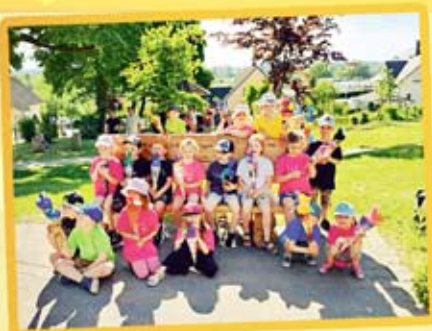
Schulanfänger aus Fockendorf